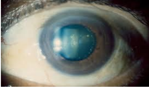
Ilustración 3. Catarata.