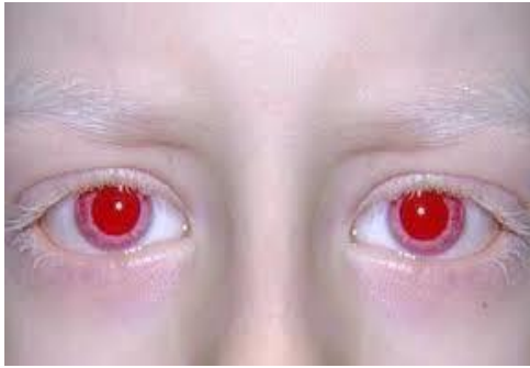
Ilustración 1. Albinismo.