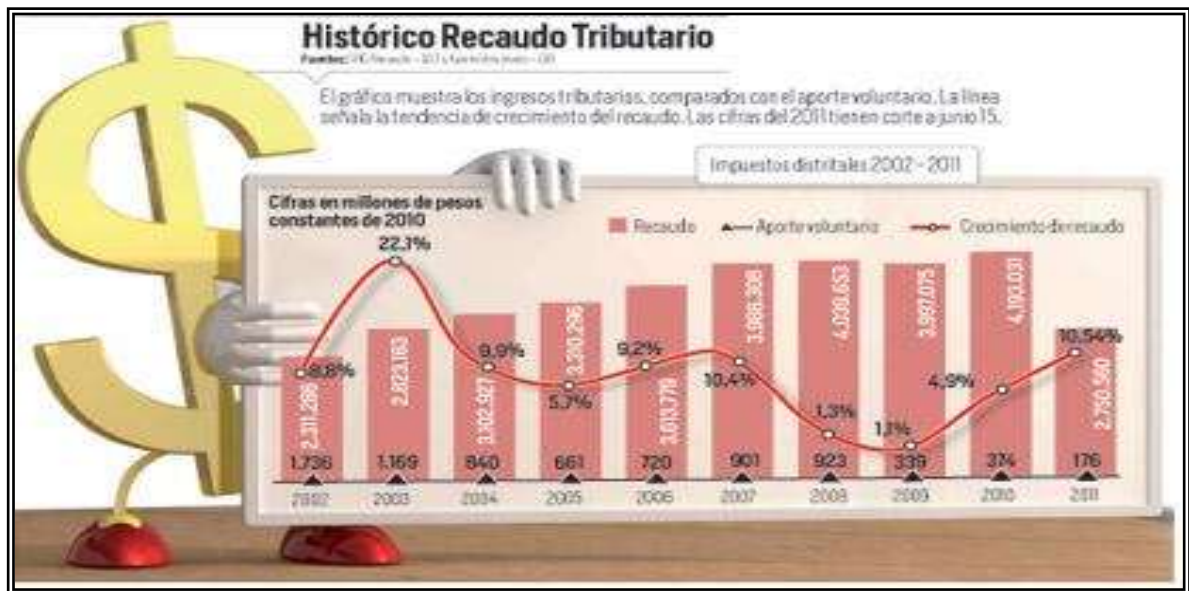
Figura 1. Informe Histórico Recaudo Tributario